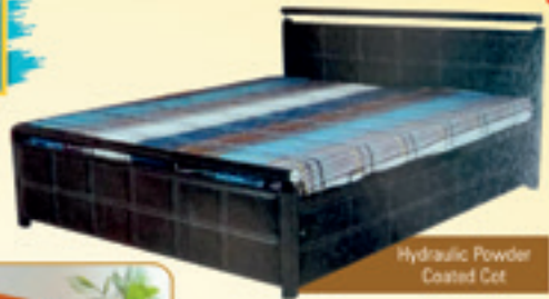
Hydraulic Powder Coated Cot