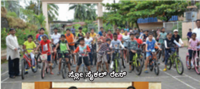
ಸ್ಕೋಲೆ ಸೈಕಲ್ ರೇಸ್