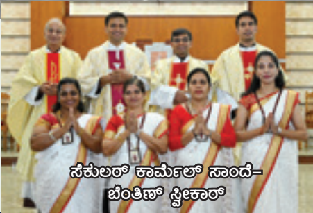
ಸೆಕುಲರ್ ಕಾರ್ನಲ್ ಸಾಂದೆ- ಬೆಂತಿನ್ ಸ್ವೀಕಾರ್