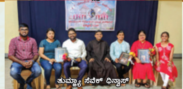
ತುಮ್ಮ್ಯಾ ಸೆವೆಕ್ ಧಿನ್ವಾಸ್