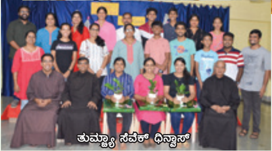
ತುಮ್ಮ್ಯಾ ಸೆವೆಕ್ ಧಿನ್ವಾಸ್