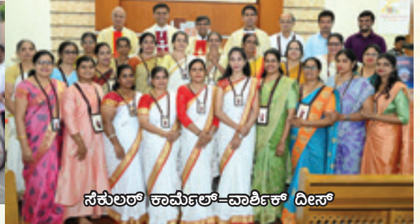
ಸೆಕುಲರ್ ಕಾರ್ನಲ್-ವಾರ್ಶಿಕ್ ದೀಸ್