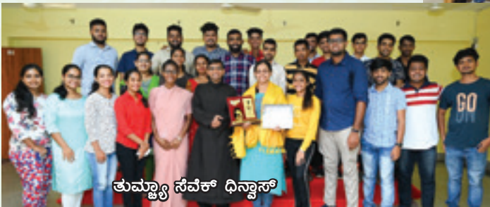
ತುಮ್ಮ್ಯಾ ಸೆವೆಕ್ ಧಿನ್ವಾಸ್