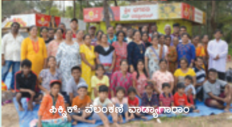
ಪಿಕ್ನಿಕ್: ವೆಲಂಕಣಿ ವಾಡ್ಯಾಗಾರಾಂ