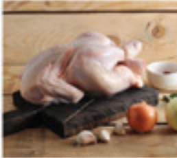
WHOLE BIRD WITH SKIN