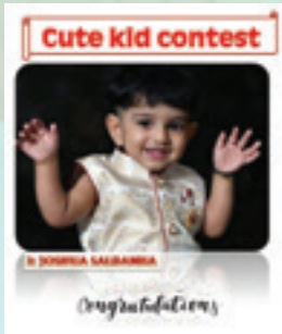
Cute kid contest