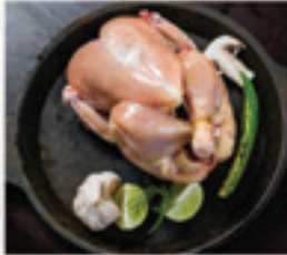
WHOLE BIRD SKINLESS