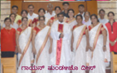
ಗಾಯನ್ ಮಂಡಳಿಚೊ ದೀಸ್