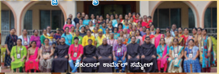
ಸೆಕುಲಾರ್ ಕಾರ್ಮಲ್ ಸಮ್ಮೇಳ್