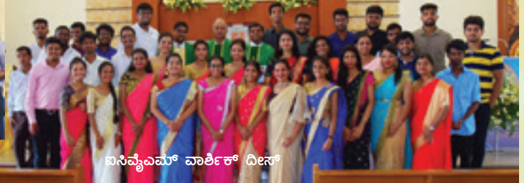
ಬಿಸ್ವೇವಮ್ ವಾರ್ಡ್ ದೀಸ್