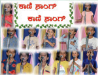
ಕಾಣಿ ಶಾಂಗ್ ಕಾಣಿ ಶಾಂಗ್