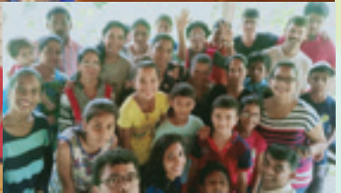
ಲ್ಹಾನ್ ಪುಲ್ ವಾಡ್ಯಾಚೆ ಪಿಕ್ನಿಕ್