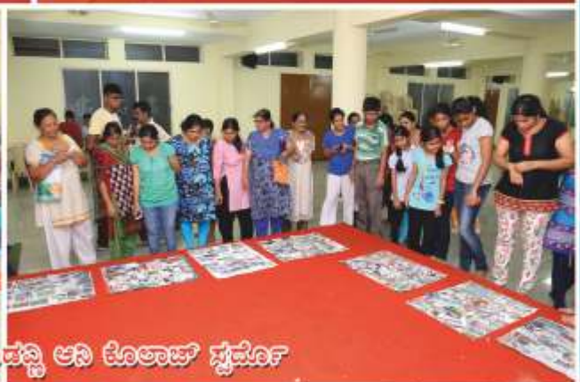
ಪಾಡ್ಯಾಪಾರ್ ಪಿಂತುರ್ ಸೊಪ್ಪಿ ಆನಿ ಕೊಲಾಟ್ ಸ್ಪರ್ವೊರ್