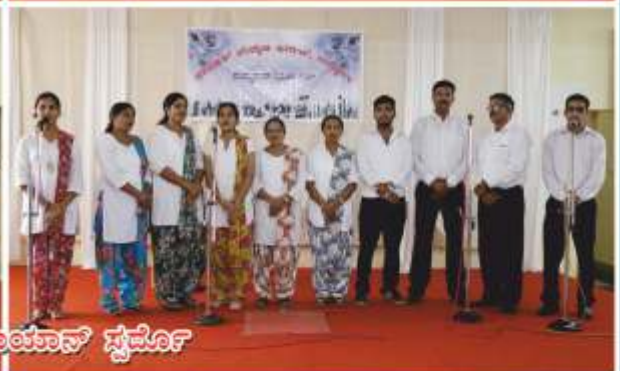
ಪಾಡ್ಯಾಪಾರ್ ಗಾಳುನ್ ಸ್ಪರ್ವೊರ್