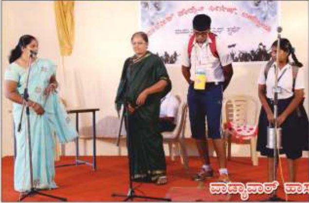
ವಾಡ್ಪಾವಾರ್ ವಾಸ್ಕುಲೆ ಸ್ಪರ್ಷೊ