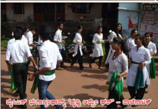
వ్యవసాయ భూగర్భం ఛాన్స్ 'కృత్రిక ఆమ్లం కార్యక్రమం' - నాటి నాటిక