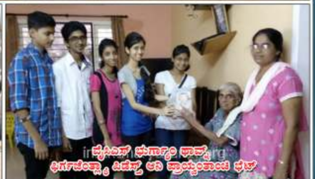
వ్యవసాయ భూగర్భం ఛాన్స్ డిగ్రీ కళాశాల అని ప్రాంగణం కార్యక్రమం