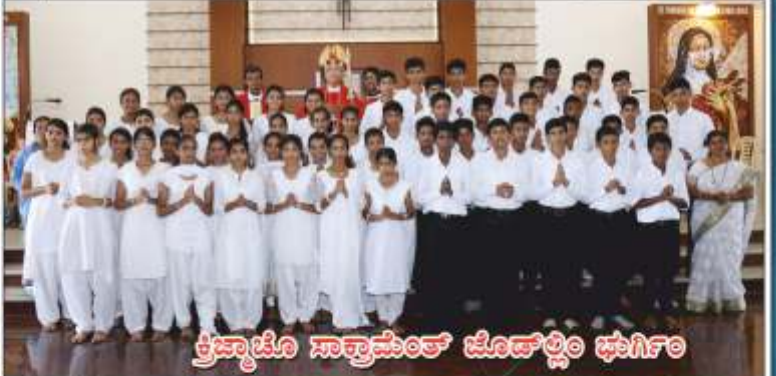
ಕ್ರಿಸ್ತಿಯೊ ಸಾಕ್ರಾಮೆಂಟ್ ಜೊಡ್ಲಿಂ ಭಾಗಿಂ