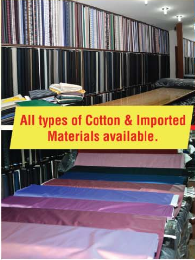
All types of Cotton & Imported Materials available.