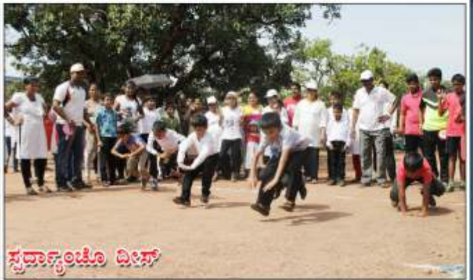
వార్తాత్ స్వదాన్యం డిలీవ్