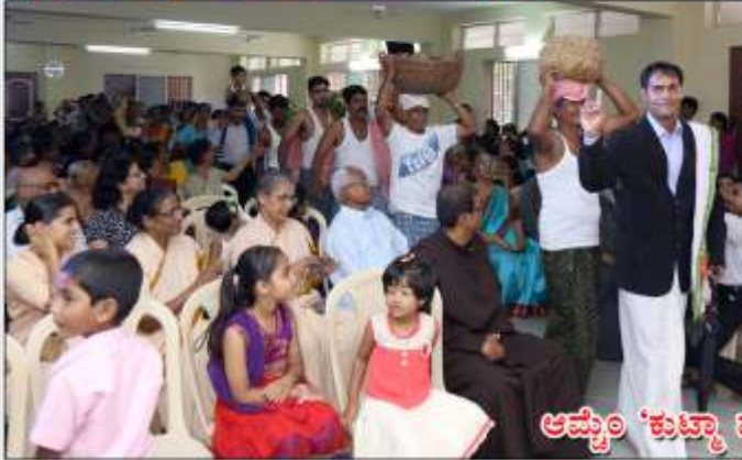
ಆಮೃತ 'ಕುಟ್ಮಾ ಘಟ್ಟ'