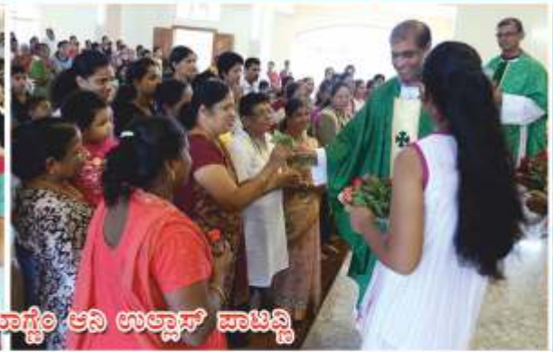
ಶ್ರೀಕ್ಷಕಾಂಬ್ಲಾ ದಿಸಾ ದಿವೇಜ್ ಪಾಸ್ತೊರ್ ಆನಿ ಉಲ್ಲಾಸ್ ಪಾಟಿನ್ವಿ