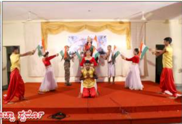
వారిశ్యావార నాట్యా స్వమోర